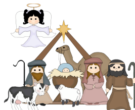
El Nacimiento del bebé Jesús.

Niños en países hispánicos normalmente celebran la noche de Los Tres Reyes Magos, el 6 de enero . Los Tres Reyes Magos visitan a los niños y los dejan regalos. Esta tradición viene de la Biblia dentro de la historia del Nacimiento del bebé Jesús. Los Tres Reyes Magos visitaron al bebé Jesús en Belén. Ellos llevaron los regalos de incienso, oro, y la mirra para el bebé.